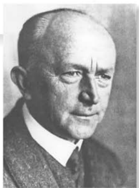
Ганс Груле (1886 – 1958)