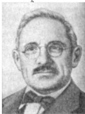
Вилли Майер Гросс (1889 – 1961)